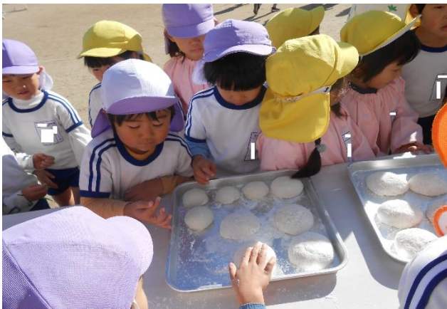
鏡餅が たくさんできたね おもち ふわふわしているね