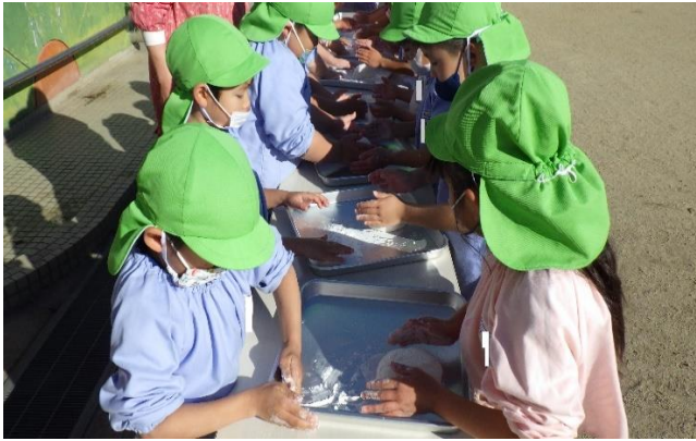
年長さんは 鏡餅づくりに挑戦しました