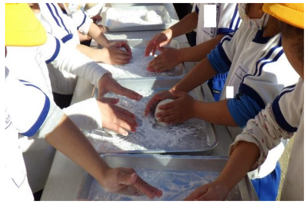
上手な 手つきですね