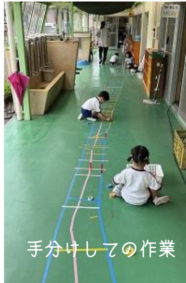
手分けしての作業