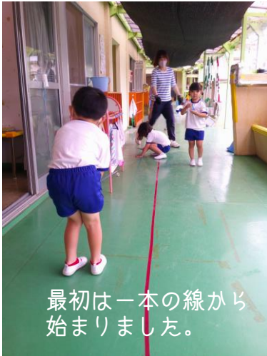
最初是一本の線から 始まりました。

「養生テープください」と職員室に入ってきたばり組さん。「養生テープ」という意外なワードに「養生テープ?」と聞き返し何に使うのが尋ねると、線路を作りたいとのこと。なるほどそういえば一昨年、ガムテープを貼って塗装が剥がれるという事態に陥った記憶がよみがえり、だれか先生が養生テープというナイスなアイディアを見出したのだと察知しました。しかし養生テープは見当たらなかったのです、ビニールテープで許してもらいました。