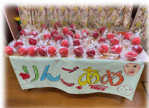
りんごあめ屋さん