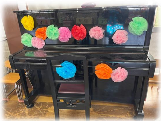
ピアノもドレスアップ

商品が並ぶホール。今年のお別れ会は、年中さんが考えて、お店屋さんごっこを企画してくれました。本物みたいな商品に目を奪われましたので、ここで紹介します！