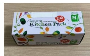
② 個人用ビニール袋