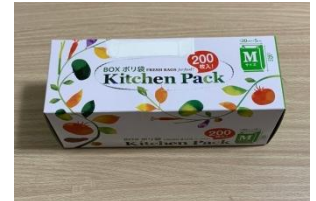
⑤個人用ビニール袋