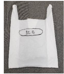
④衣類用汚れ物入れ袋