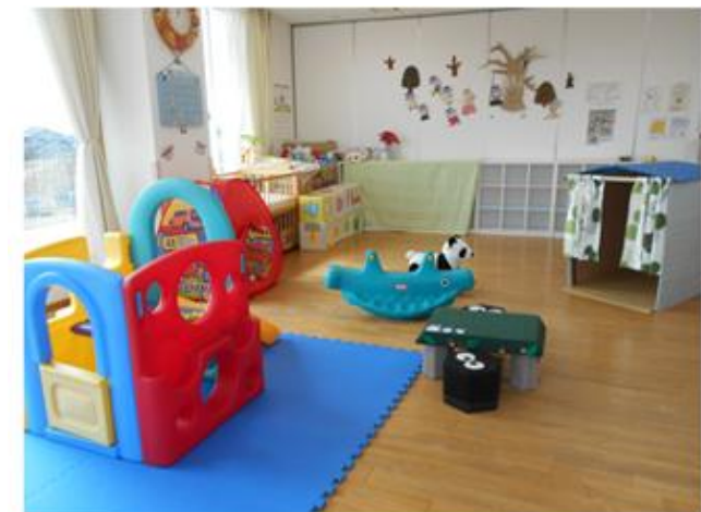
ほっとできる子育て支援室