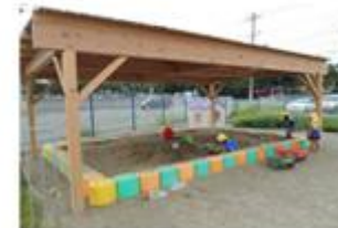
子どもたちに人気の砂場