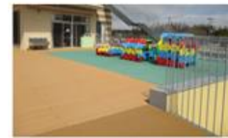
遊具エリアの開放